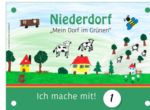
Gemalt von Ida Schauer, 8 Jahre aus Niederdorf.

Zeigen Sie es uns so richtig! Egal, ob Sie am Wettbewerb teilnehmen oder nicht. Mit der „Mein Niederdorf“ Plakette präsentieren Sie sich als stolzer Niederdorfer. Dabei können Sie zwischen einem hochwertigen Metallschild und einem Aufkleber wählen - oder einfach beides mitnehmen.*